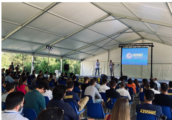
L'apertura del Congresso Nazionale di Azione Universitaria

Il 2 e 3 luglio a Bologna si è tenuto il secondo Congresso Nazionale di Azione Universitaria, l'associazione universitaria di Fratelli d'Italia, figlia del FUAN del MSI.