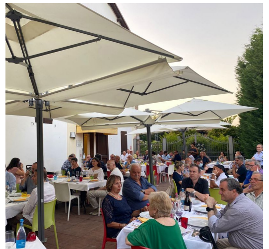
Cena d'Estate di FDI Modena