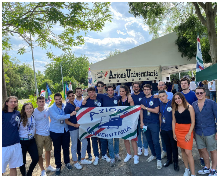
La Comunità di AU di Modena e Reggio Emilia al Congresso Nazionale

All'interno della classe dirigente è stato eletto il