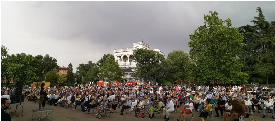
Presentazione del libro di Giorgia Meloni a Bologna