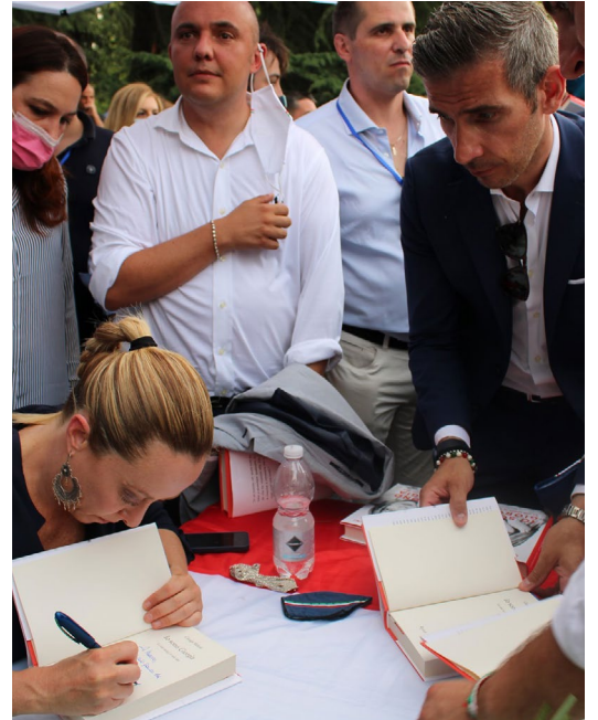
Presentazione del libro di Giorgia Meloni a Bologna