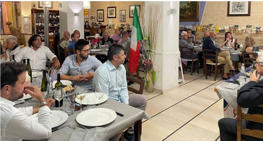
Cena d'Estate di FDI Pavullo