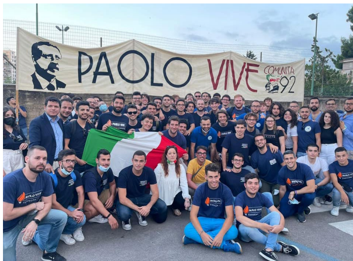
La commemorazione di Paolo Borsellino organizzata da Azione Universitaria e Gioventù Nazionale