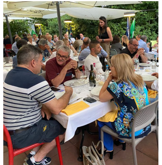
Cena d'Estate di FDI Modena