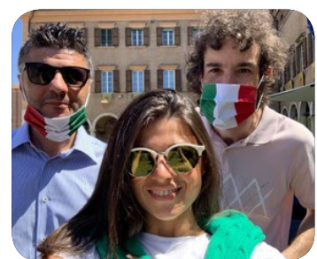
FRATELLI D'ITALIA PAVULLO NEL FRIGNANO

L'operazione di riduzione tributi realizzata con questa iniziativa vale complessivamente 275.000€ che, sommata all'operazione di fine maggio 2021 (compensazione imprese per danni da COVID anno 2020), per un importo di 340.000€, costituiscono un sostanzioso sostegno di 615.000€ a favore di cittadini e imprese.