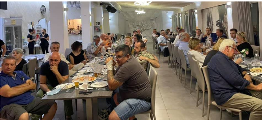
Cena d'Estate di FDI Finale Emilia